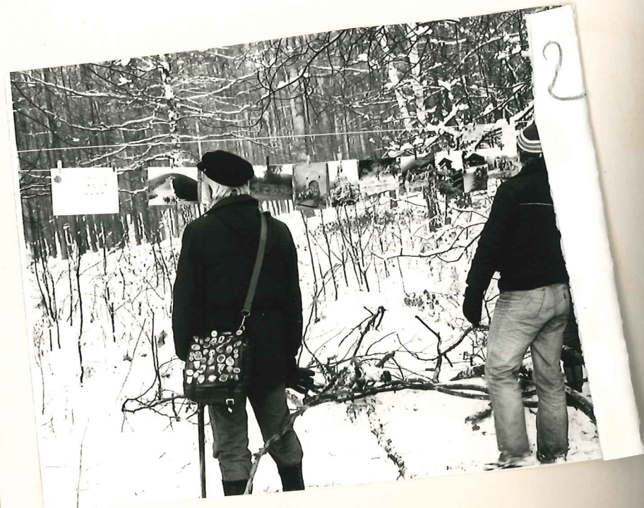
NA "GRAPIE '83"

Ścieżka Kun... per la klubo, prezen tekstoj metrop. zinta la tur do de Mian samid Maria per la Esperan umis Mi lig nia pr indecc demon